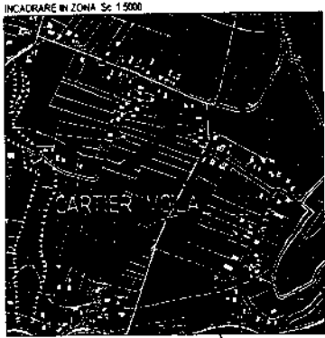
INCADRARE IN ZONA Sc 1:5000 Amplasament

SUPRAFATA STUDIATA: 2922,00 mp , din care: - 1963 mp - Str. Rândunicii - 61 mp - Mun. Câmpina (nr.cad.26077)